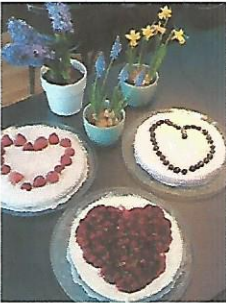
Monchoutaart à € 15,00