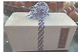
Doosje bonbons 250 gram € 9,00