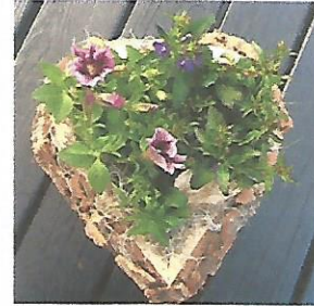
Bloemstuk Hart € 27,50