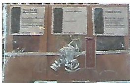
Theepakket met chocolade hartjes € 10,00