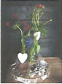
Bloemstuk op hout € 25,00