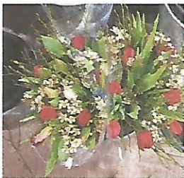
Bos Bloemen € 15,00