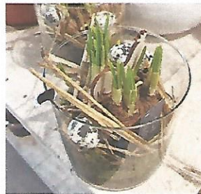
Glazen Stolp € 12,50